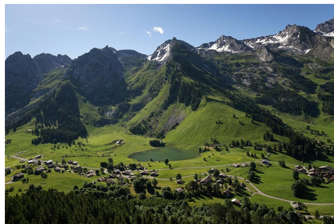
Le lac des Confins près de La Clusaz.

Sur un plan de masse du futur site, on mesure l'étendue des travaux projetés. Les pistes de ski courent le long de la zone Natura 2000 des combes des Aravis, puis descendent vers le futur stade, sa tribune de 1 500 places, les différentes « surfaces JO » – sport, fédération internationale, famille olympique, médias, organisation, parking. Des triangles et des ronds signalent aussi un peu partout sur ce plan la présence d'oiseaux, de crapauds, d'écureuils roux, de vipères aspics, et l'Azuré du serpolet, un papillon présent dans la zone, comme dans plusieurs zones humides.