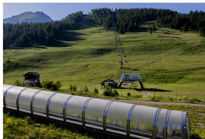
Les pentes du domaine skiable de Montgenèvre, site olympique où plus de 3 hectares de forêt sont menacés par la construction de futurs parcours de snowboardcross et de skicross.

Initialement évaluée à 295 millions, désormais « réduite » à 133 millions d'euros, cette opération immobilière hors norme vise à réhabiliter puis à commercialiser, en logements, commerces et hôtel, 17 000 mètres carrés de plancher sur un périmètre de 41 hectares entourés par 4,5 kilomètres de remparts à entretenir, en y incluant une usine abandonnée située en contrebas.